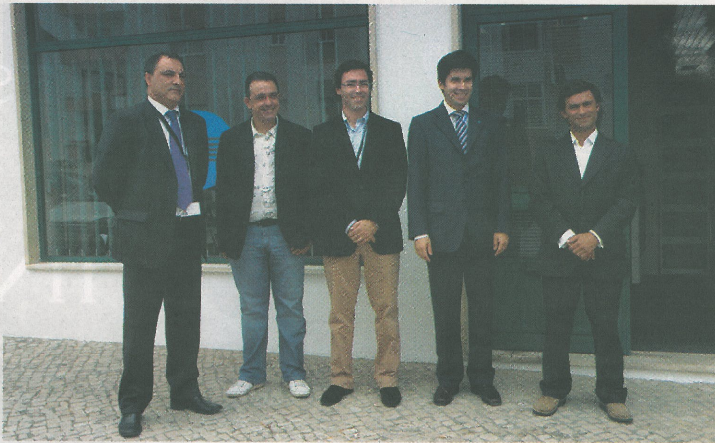
Grupo Fábrica e Konica Minolta celebram aliança nas Caldas

"Estamos interessados em proporcionar às empresas da região o mesmo que